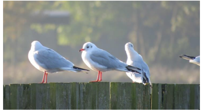
Kokmeeuwen in winterkleed

We hebben even goed staan kijken naar de Kokmeeuwen. Zonder hun zwarte kop (zomerkleed) zien ze er zó anders uit dat niet iedereen ze meteen herkende. In winterkleed hebben ze een witte kop met een zogenaamd zwart 'koptelefoontje'.