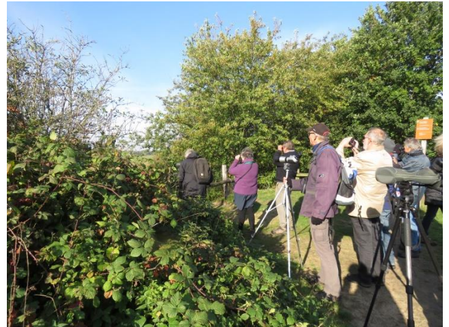
Zanglijster in beeld .....

We hebben tijdens onze wandeling 36 soorten vogels waargenomen, namelijk Fuut, Aalscholver, Blauwe Reiger, Knobbelzwaan, Grote Canadese Gans, Grauwe Gans, Kolgans, Wilde Eend, Krakeend, Kuifeend, Sperwer, Buizerd, Torenavalk, Meerkoet, Waterhoen, Kokmeeuw, Holenduif, Houtduif, IJsvogel, Groene Specht, Grote Bonte Specht, Graspieper, Heggenmus, Roodborst, Merel, Zanglijster, Staartmees, Pimpelmees, Koolmees, Boomklever, Spreeuw, Gaai, Ekster, Kauw, Zwarte Kraai en Vink.