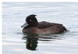
vrouw kuifeend