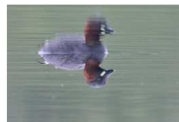
dodaars in broedkleed