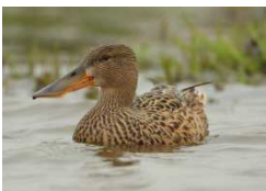
vrouw slobbeend

Verder waren er mooie slobbeenden, kuifeenden en wintertalingen te zien, en achter het riet een dodaarsje en een knobbelzwaan. We zagen maar één tureluur, maar waarschijnlijk zaten er wel meer tussen het riet verscholen.