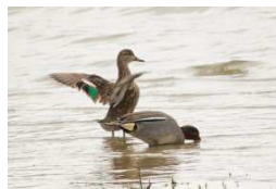
paar wintertaling