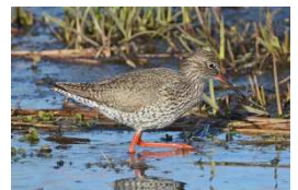
tureluur in broedkleed

Het was weer een mooie excursie! De bittere kou zorgde voor een scheiding der geesten in de groep, tussen de wel en niet koudebestendigen. De laatsten waren eerder bij de auto's en misten de blauwborst en de kneu, maar te zien kregen we die niet. Gelukkig gaan we de warme kant op: de volgende excursie is op zaterdag 30 mei. De lesavond op woensdag 20 mei. De ruimere tijd ertussen heeft te maken met het pinksterweekeinde. Thema: heidevogels. We hopen u dan weer te zien!